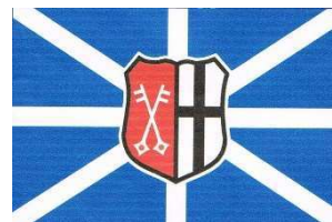
Rudergesellschaft Zeltingen e.V.